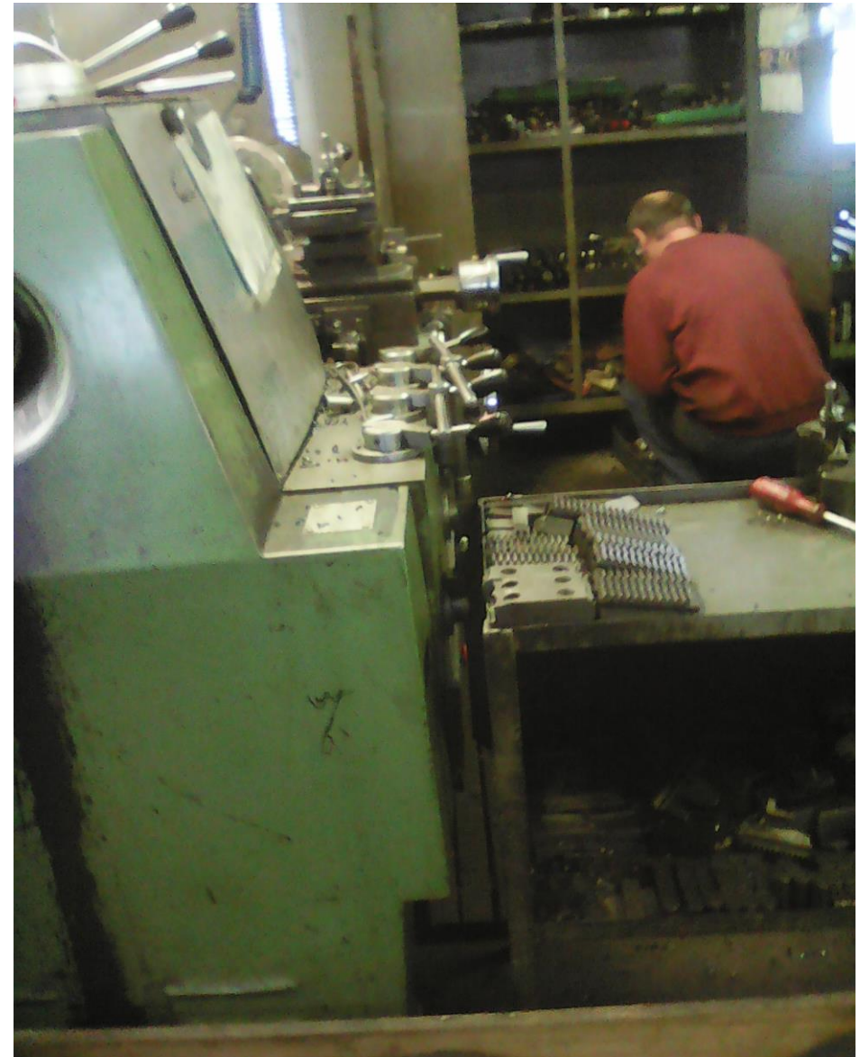
A gépek – az egyszerűbb